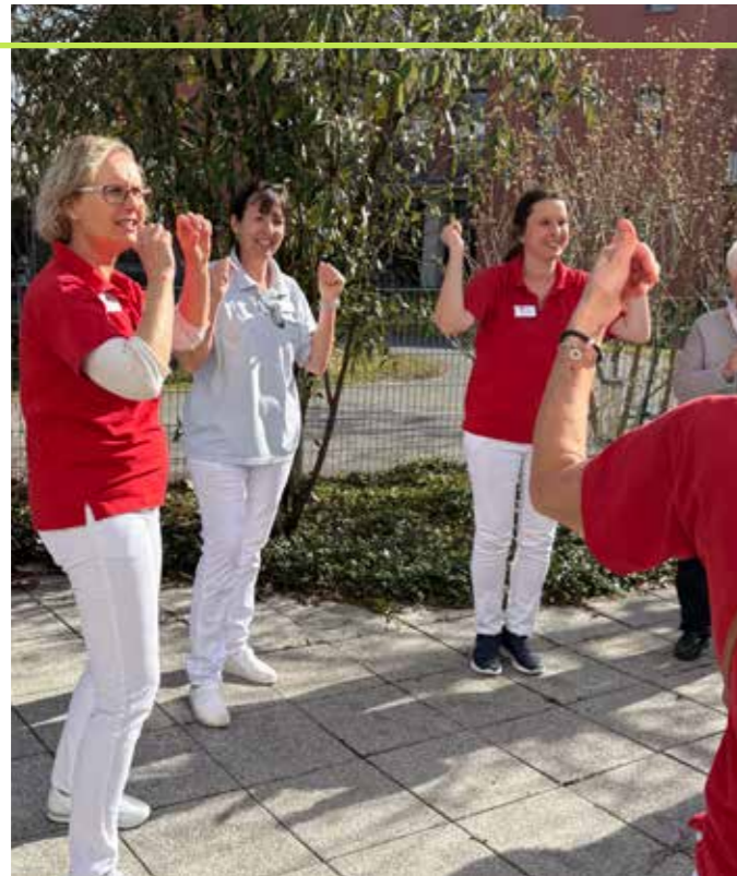
LACH YOGA FÜR MITARBEITER