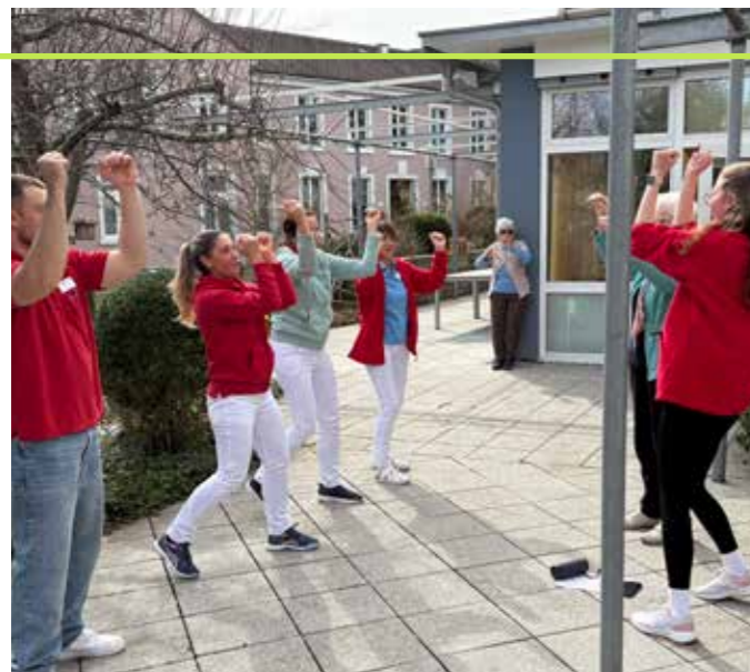
FITNESS, DIE SPASS MACHT: ZUMBA