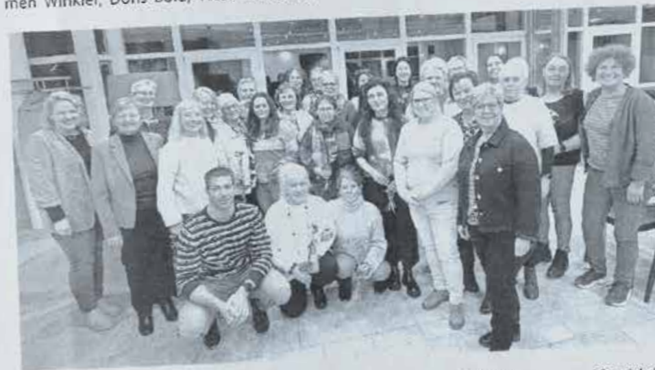
Die Mitarbeitenden, die geehrt wurden, im Kreis von Vorstand sowie Wohnbereichs- und Bereichsleitungen.