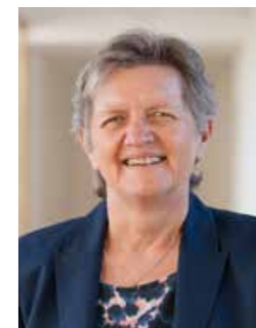
Für alle Mitarbeiterinnen und Mitarbeiter

Wir wünschen Ihnen viel Freude beim Durchblättern und Schmökern unserer Hauszeitung. Gestalten Sie die Lektüre als Ihre persönliche Genusszeit in schöner Umgebung, mit Ruhe und vielleicht einem Lieblingsgetränk.