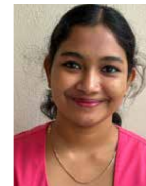
Anns Jibi FSJ Wohngruppe Herrentisch/Rosenegg